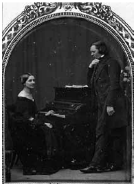
ROBERT SCHUMANN (1810-1856)