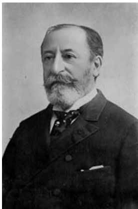
CAMILLE SAINT-SAËNS (1835-1921)