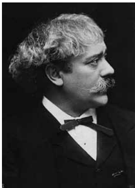
PABLO DE SARASATE (1844-1908)