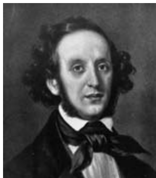
FELIX MENDELSSOHN BARTHOLDY (1809-1847)